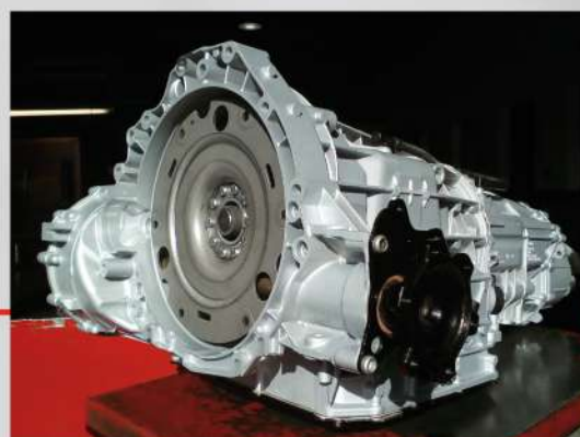
Audi - OB5

Spécialistes dans le reconditionnement et la réparation de boîtes de vitesses manuelles et automatiques, nous intervenons sur le territoire national dans les 24h.