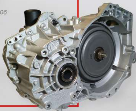
Volkswagen - DSG6