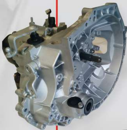
PSA - 20CQ06