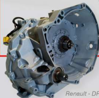
Renault - DPO

Euro-Trans est reconnu pour la qualité de son écoute et la pertinence de ses conseils.